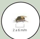
Mosca a mida real

Els simúlids o mosques negres són unes mosques autòctones, petites, d'una mida entre 2 i 6 mm, de color generalment fosc, amb el cos rabassut, les antenes i les potes curtes i les ales més grans.